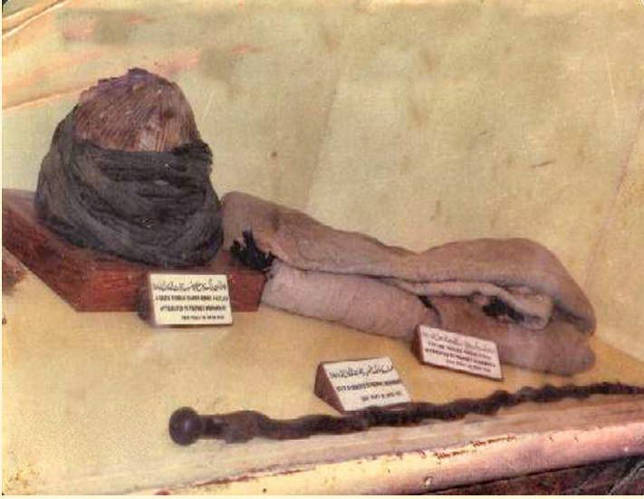
عمامة وجبة وعصا النبي صلى الله عليه وسلم

فيه أن رسول الله ﷺ كان يفعله قال أبو هريرة كان رسول الله ﷺ إذا خرج يوم العيد في طريق رجع في غيره، قال الترمذي هذا حديث حسن وقال بعض أهل العلم إنما فعل هذا قصدا لسلوك الأبعد في الذهاب