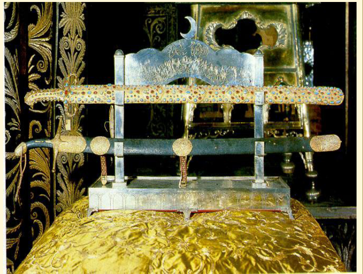
سيف الرسول صلى الله عليه وسلم

ويكره أيضا تقبيل التابوت الذي يجعل فوق القبر كما يكره تقبيل القبر واستلامه وتقبيل الأعتاب عند الدخول لزيارة الأولياء نعم إن قصد بتقبيل أضرحتهم التبرك لم يكره كما أفتى به الوالد رحمه الله «حاشية الجمل على شرح المنهج ج ٢/ ٢٠٦».