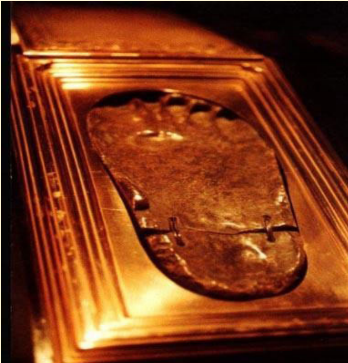
اثر قدم الرسول صلى الله عليه وسلم

وفي دار الحديث لطيف معنى *** أصلي في جوانبها وأوي لعلي أن أمس بحر وجهي *** مكانا مسه قدم النواوي